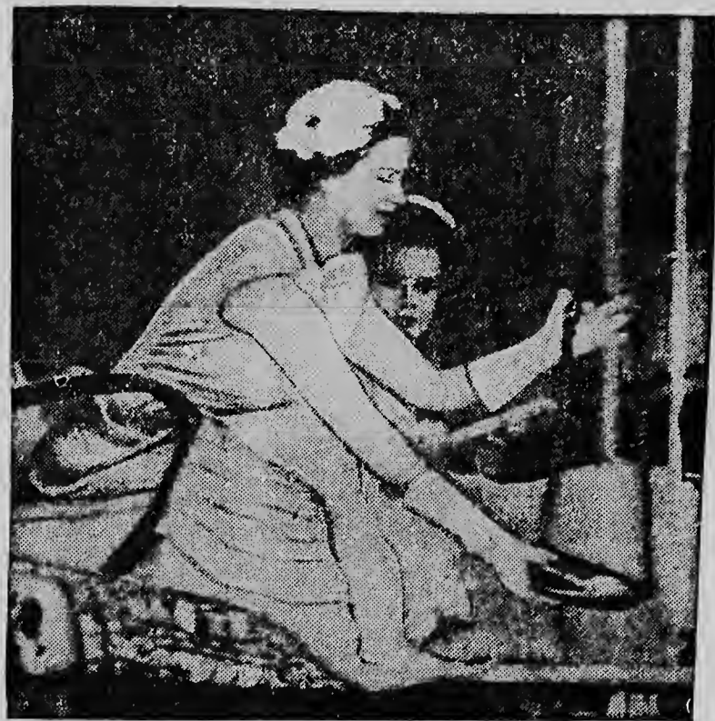
In Albert Park, Suva, op de Fidji eilanden, ontving Koningin Elizabeth II een walvstand ten geschenke, ten teken van welkom. De ontvangt op deze eilanden was allerhartelijkst.